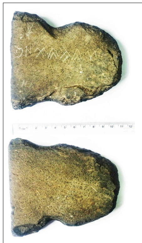
1-сурет – Көне түрік бітік жазулы мәтіннің фотосуреті (Ғ.Қ. Омаров, Н. Базылхан, 2015 ж.)

Сөйтіп, Шығыс Қазақстан облысы Күршім ауданы Ақбұлақ ауылдық округіне қарасты Қабырғатал фермасы төңірегінде табылған аталмыш тастағы мәтін көне түріктердің киелі мекені – Алтай тауының оңтүстік-батыс бөлігінен табылуы табиғи заңдылық. Бұл тастағы көне түрік мәтінінің таңба-графикалық ерекшелігі Талас ескерткіштеріне жақын. Сондықтан аталмыш тастағы мәтіннің хронологиясы Он оқ, Түргеш (VIII-IX ғасырларға) дәуіріне қатысты болуы әбден ықтимал.