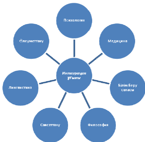
2-сурет – Интеграция ұғымының кең ауқымдылығы

«Интеграция» ұғымының өзі кең мағыналы, ол көптеген салада кездесетін ұғым (сурет 2) :