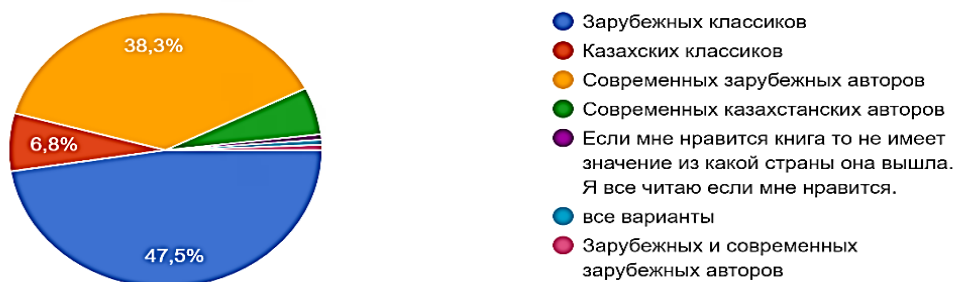
Рисунок 2 – Распределение ответов респондентов на вопрос «Произведения каких авторов Вы предпочитаете?»

Следующие вопросы анкеты были связаны непосредственно с казахской литературой и были направлены на установление уровня знаний респондентов казахских писателей и их произведений. Как показали результаты исследования, большинство респондентов выбрали правильные варианты ответов на вопросы, в которых необходимо было назвать имя автора того или иного произведения. Так, на вопрос «Назовите автора произведения «Путь Абая»», 84 % респондентов дали правильный ответ,