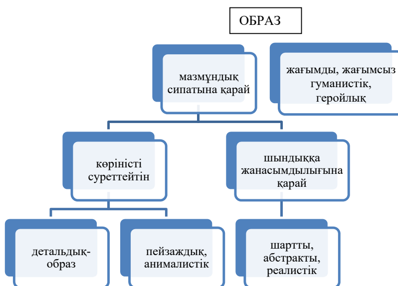
4-сурет – Образ түрлері

Оқырман шығарма мәнін образ арқылы таниды. Ежелгі адамның дүние мен өзін тану формасын мифтен, мифтік образдардан көреміз. «Миф – адамның болмысты, өзін қоршаған ортадағы өмірдің мәнін тануға ұмтылудағы бірінші бастау көз боп табылады» (Мәуленов, 2015: 18). Мифологияны адамның дүниені образды