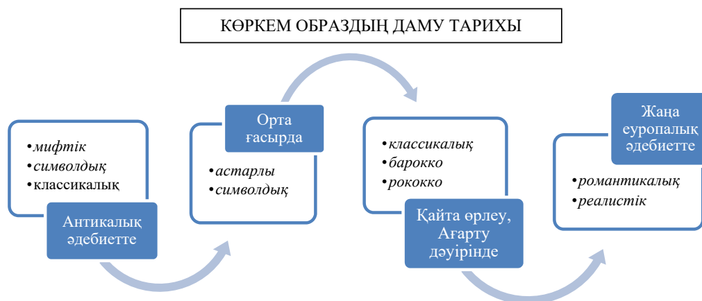
2-сурет – Көркем образдың даму тарихы