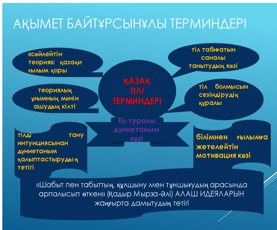
1-сурет – А. Байтұрсынұлы терминдерінің мәндік сипаты

Практикалық тұрғыдан тіл терминдерін оқытудың мотивациялық сипатын арттыру үшін бірнеше әдістер өзара сабақтастықта жүзеге асырылып, әртүрлі оқыту формаларын үйлесімде қолдануға мән берілді. Басты мақсат білім алушының тіл туралы дүниетанымын қалыптастыру болғандықтан, түпкі күтілетін нәтижесі тіл атаулының: