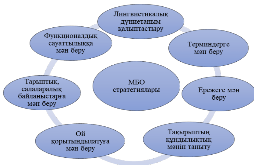
1-сызба – «Мән бере оқыту технологиясының стратегиялары»

Алдымен, бұл оқыту әдісі түрінде қолданылып жүрді. Тәжірибе барысында тек терминге ғана емес, теориялық ережелерге де мән бере оқыту керектігіне көз жетті. Уақыт өте келе баланың білімі үзік-үзік берілмей, тілді тұтастай танытуға жетелеу үшін тақырыпаралық, салааралық, интеграциялық байланыстарға мән бере оқыту жайлы тұжырымдар туды. Келесі кезекте баланың тілді тек құрал ғана емес, оны құндылық ретінде де түйсінуді қамтамасыз ету мақсатындағы ізденістер «Мән бере оқыту» – «МБО» деп аталатын технологияның өзара сабақтас жеті стратегиясын анықтауға алып келді (1-сурет).