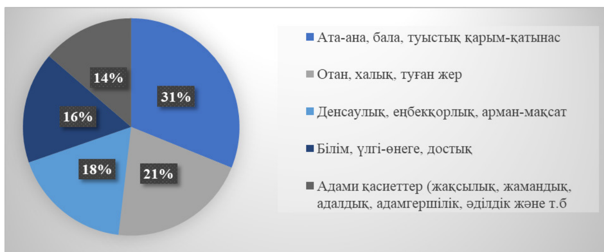
2-сызба – Мақал-мәтелдердегі тақырыптардың қолданыстық өрісі

Зерттеу барысында жүргізілген сауалнамаға қатысушылардың басым көпшілігі қазақ мақал-мәтелдерінің адалдық, әділдік, бірлік, достық және отбасы құндылықтарын танытатын мақал-мәтелдерді жиі пайдаланытынын көрсетті. Төмендегі сызбада қазіргі құндылықтар аясында мақал-мәтелдердің қолданылу өрісі берілген: